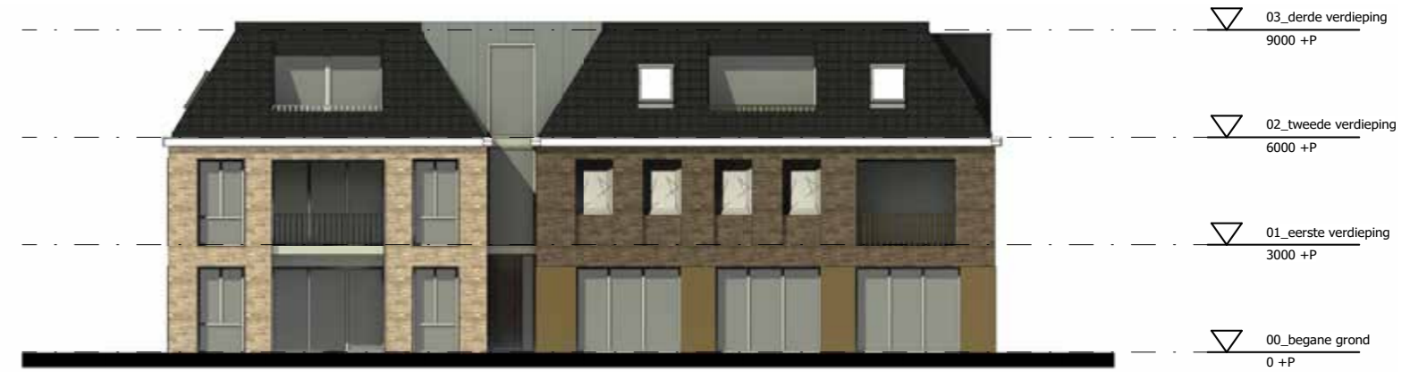
Rechter zijgevel (Stationstraat)