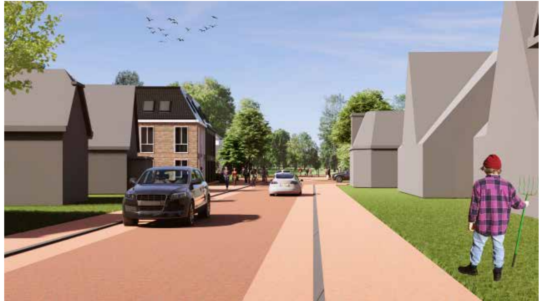
Impressie vanuit de Stationsstraat