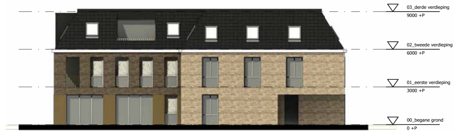
Linker zijgevel (Asserstraat)