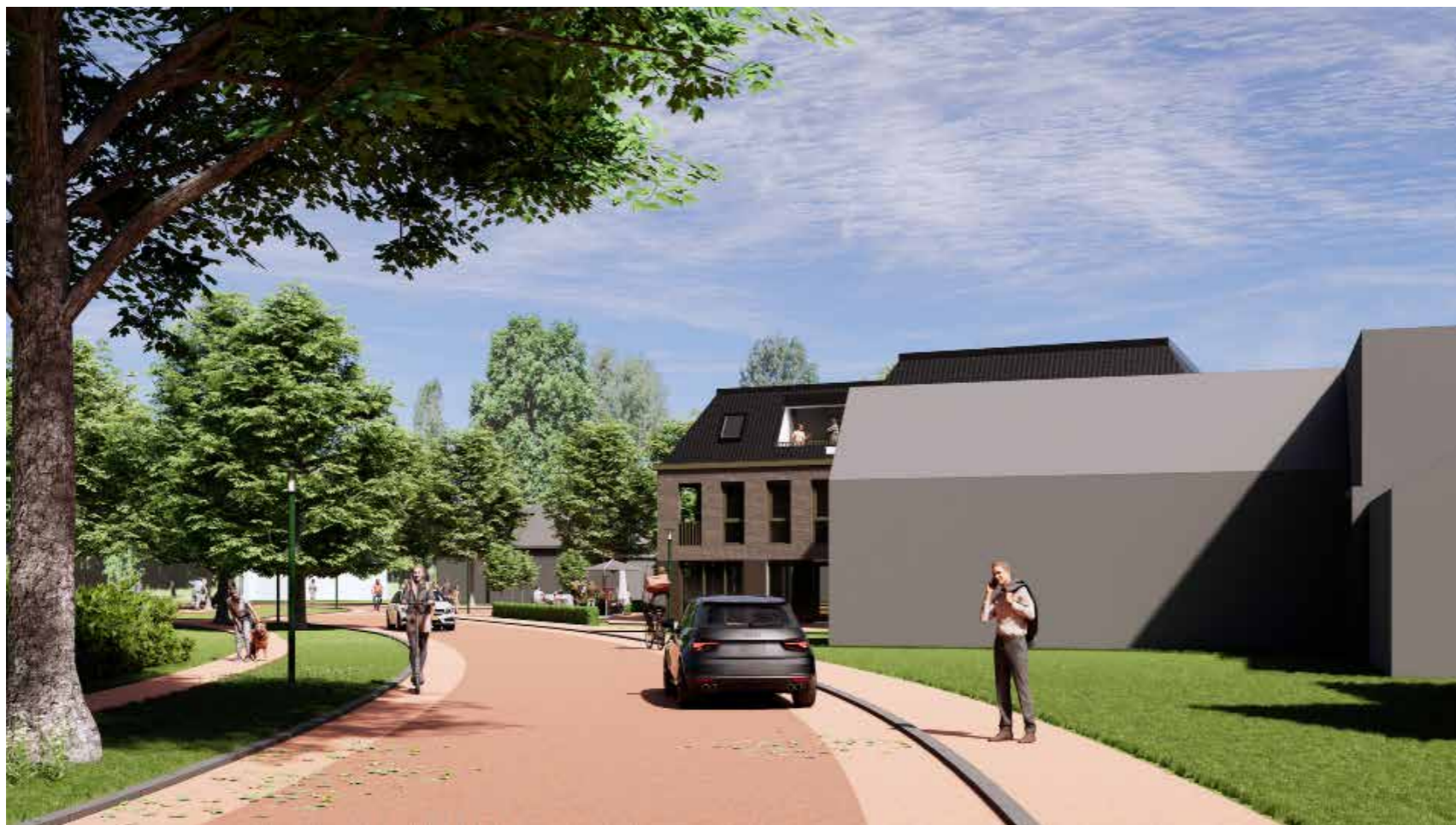
Impressie vanuit de Asserstraat